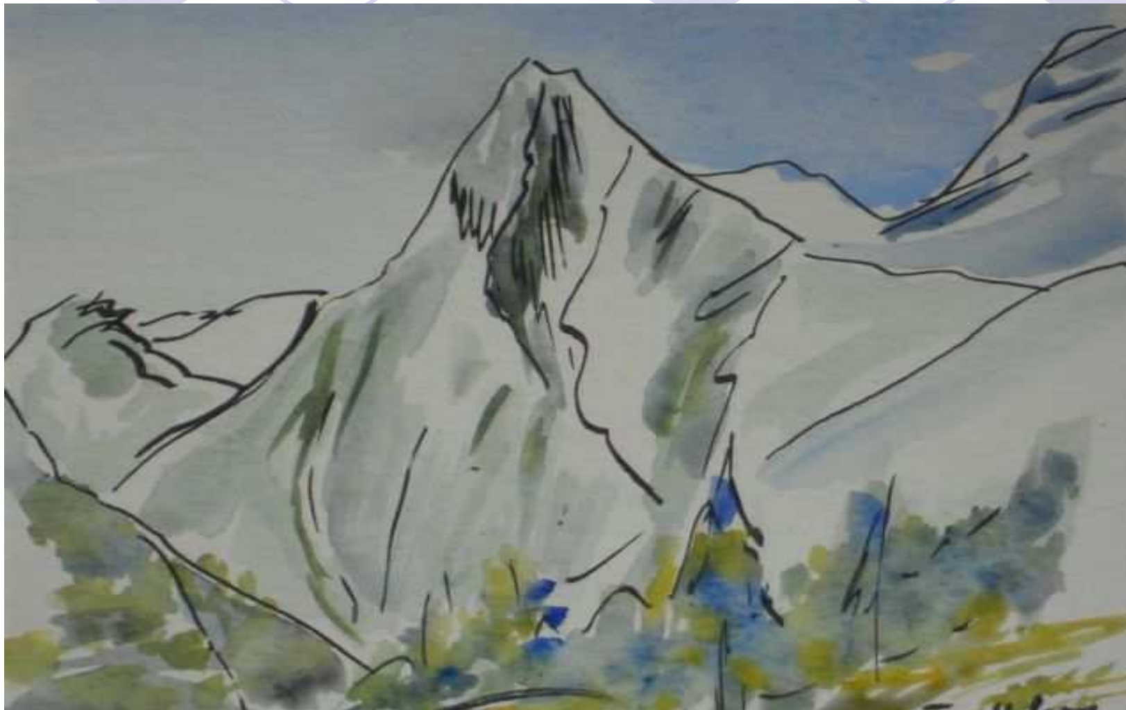
Vallée du lavercq - Barcelonnette