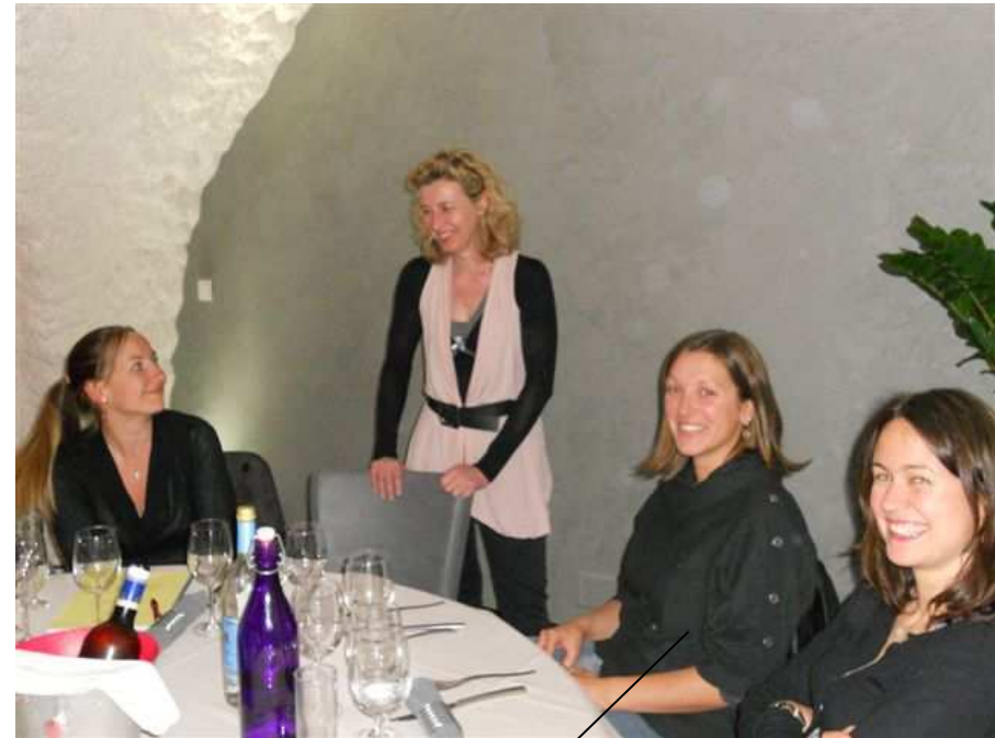
Médecins stagiaires 05