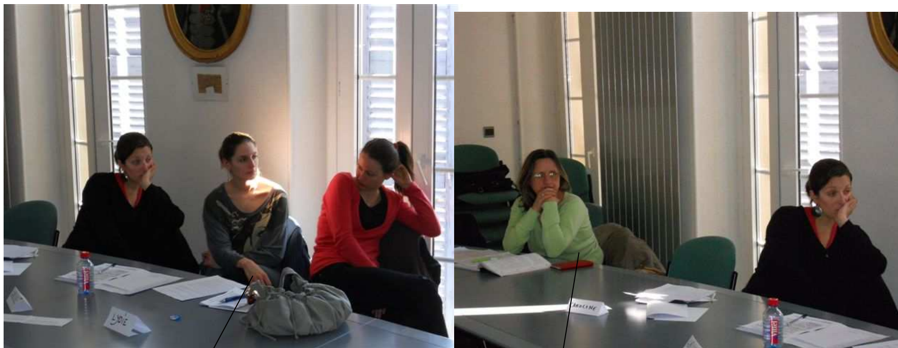
Médecins stagiaires 05