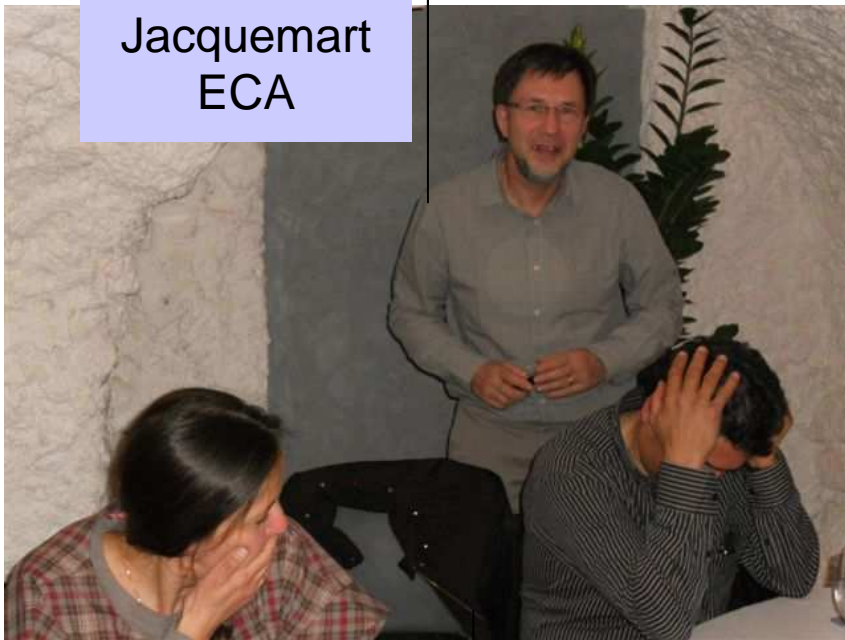
Les medecins de Laragne